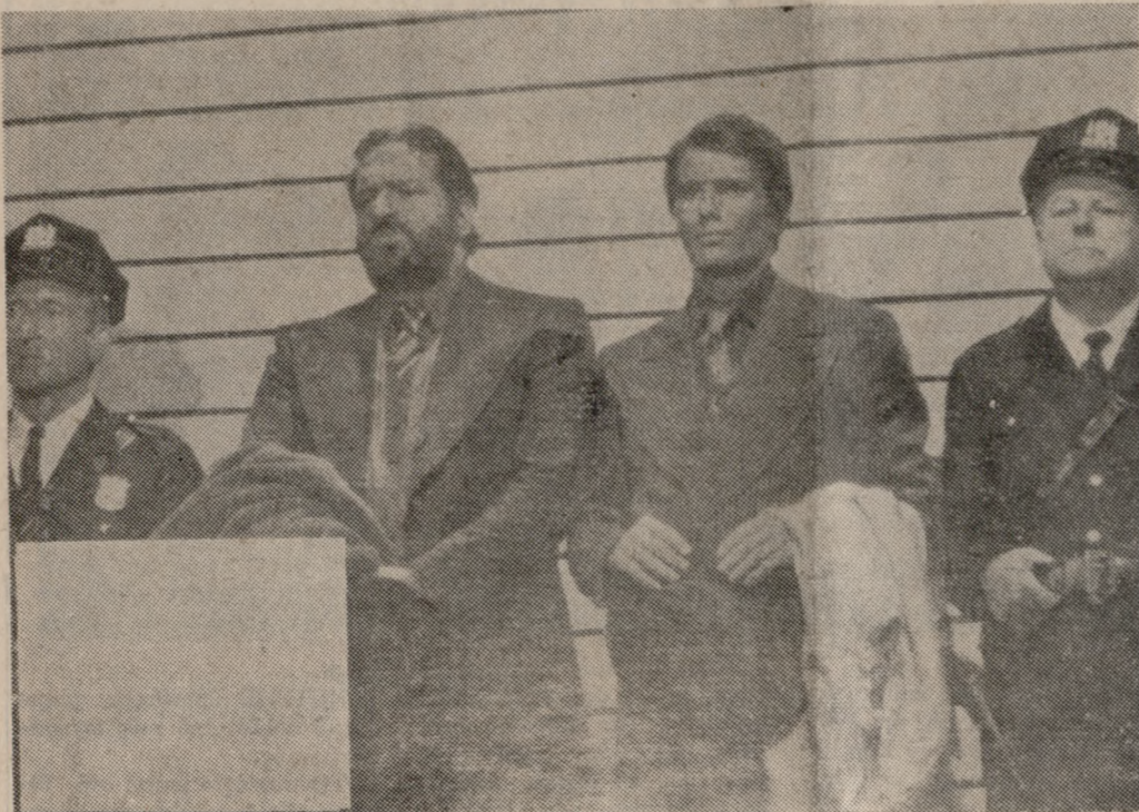
«ΤΡΙΝΙΤΑ ΕΝΑΝΤΙΟΝ ΑΛ ΚΑΠΟΝΕ». Ο Μπιάτ Σπένσερ και ο Μονγκόμερι Γουίντ στην ταινία του Κλάτσερ. Κάτι διαφορετικό από τα μέχρι τώρα γνωστά.

ΤΑΙΝΙΕΣ πρώτης προβολής θα προβάλει έφετος ο κινηματογράφος «ΑΠΟΛΛΩΝ» (Υπόγειος), η διεύθυνση του οποίου εξασφάλισε την συνεργασία με την «ΣΠΕΝΤΖΟΣ ΦΙΛΜΣ». Το «μπλόκ» των ταινιών του Σπέντζου στηρίζουν δυο πραγματικοί γίγαντες της Άγγλικής παραγωγής, η Ε.Μ.Ι. και η I.T.C., υπάρχει δε μεγάλη προέκταση σε καταπληκτικές ταινίες διεθνούς παραγωγής. Έξ' αλλού η διεύθυνση του «ΑΠΟΛΛΩΝΑ» διάλεξε ταινίες που μπορούν να ικανοποιήσουν όλα τα γούστα. Έτσι θα προβάλει από πορνό και καράτε μέχρι δραματικές και ιστορικές. Για τους αναγνωστές μας — φίλους του κινηματογράφου θα δώσω με άμεσως μερικά «δείγματα» των ταινιών που θα προβληθούν στην φετινή χειμερινή περίοδο στον «ΑΠΟΛΛΩΝΑ».