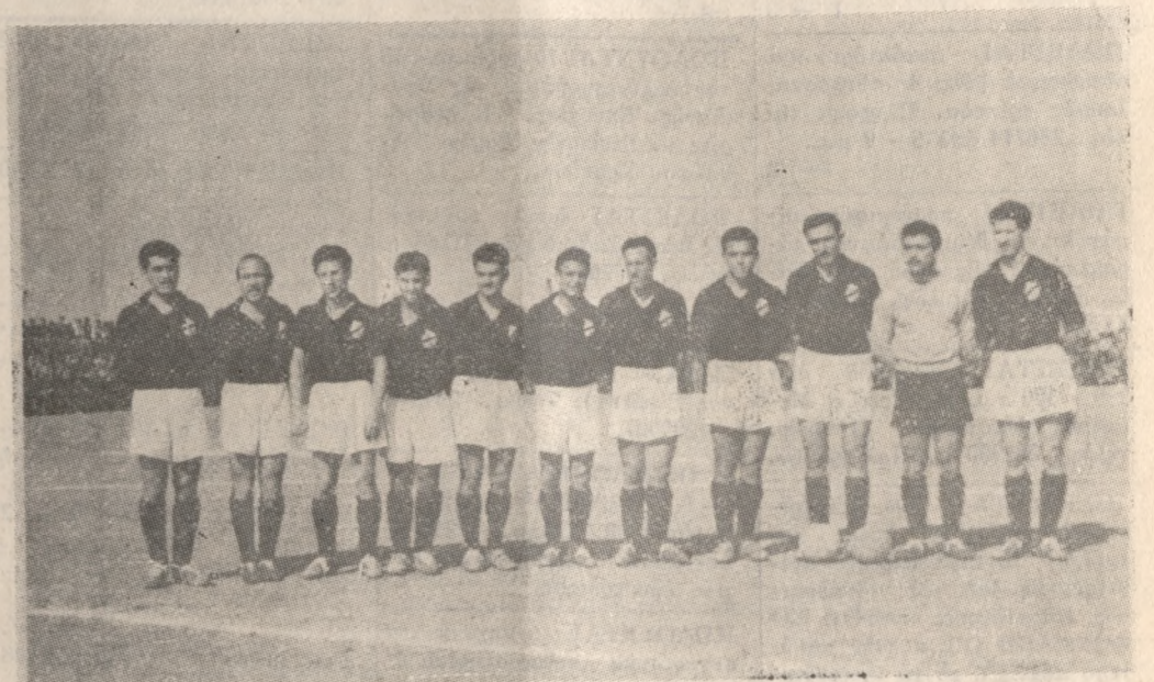
Νά οι παλιές δόξες του ΟΦΗ. Λίγοι, δυστυχώς, από αυτούς πήραν μέρος στον προχθεσινό άγώνα με τους παλαιμάκους.