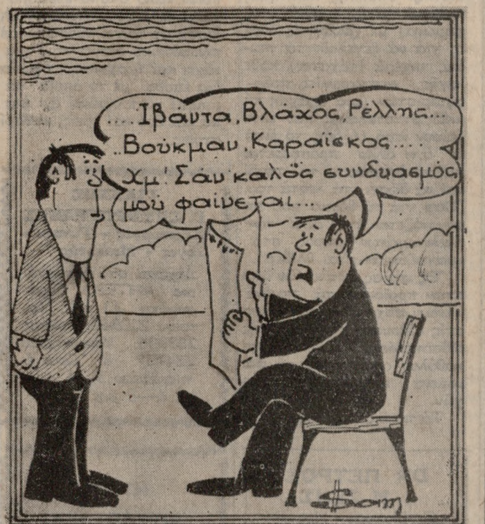
(Τού ΒΑΓΓΕΛΗ ΣΑΜΑΡΑΚΗ)