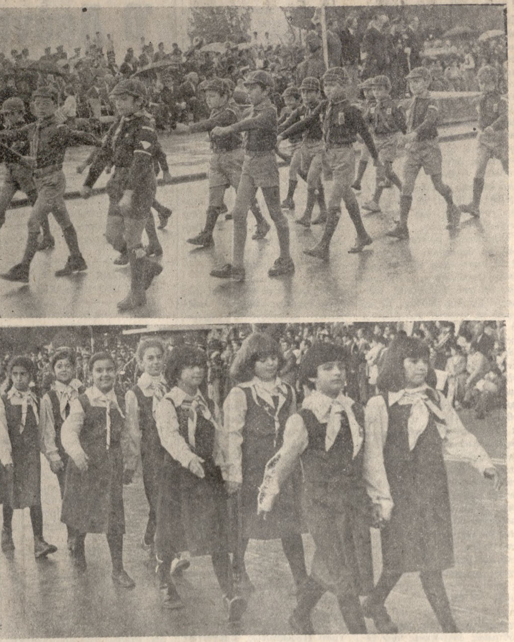
Παρά τις δυσμενείς καιρικές συνθήκες τά μικρά Λυκόπουλα και τά Πουλιά παρέλασαν προχθές κομάρωτά και πήραν πολλά χειροκροτήματα. Αυτό άποδεικνύουν και τά παραπάνω δύο στιγμιότυπα. Φωτορεπορτάζ: Β. ΔΡΟΣΟΣ τηλ. 221830

ΖΗΤΟΥΝΤΑΙ ΖΗΤΕΙΤΑΙ ηλεκτρονικόλογική. Συνεχές άρτιο. Πληροφ. τηλέφ. 236221. 1 — 5 ΖΗΤΕΙΤΑΙ δεσποινίς ή κυρία άπόφοιτος Γυμνασίου διά γαρυφεία. Πληροφ. τηλέφ. 821219