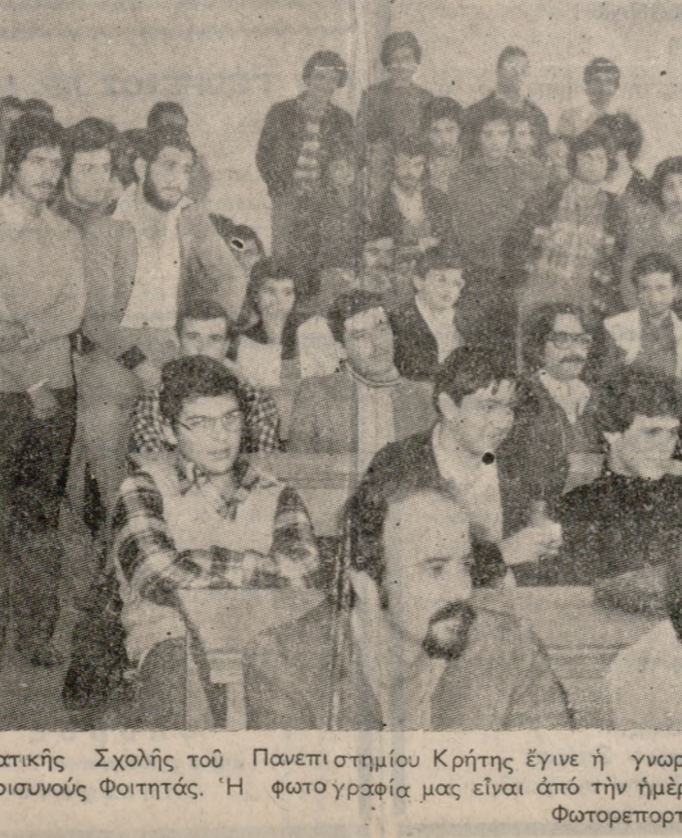
Χθες στα κτίρια της Μαθηματικής Σχολής του Πανεπιστημίου Κρήτης έγινε η γνωριμία των νέων φοιτητών με τους Καθηγητές των και περιουούς Φοιτητές. Η φωτογραφία μας είναι από την ημέρα της γνωριμίας.