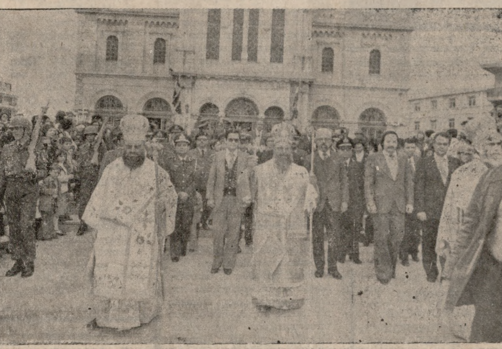
Δύο στιγμιότυπα ἀπὸ τῆς χθισινῆς μεγαλοπρεπῆς τελετῆς τῆς περιφοράς τῆς εἰκόνας τοῦ Ἁγίου Μηνᾶ. Πάνω, ἡ εἰκόνα τοῦ Πολιοῦχου ποῦ προπορεύεται τῆς πομπῆς. Κάτω, ὁ Ἀρχιεπίσκοπος στὸ κέντρο καὶ οἱ Μητροπολίτες κ.κ. Θεόδωρος καὶ Εἰρηναῖος λίγο ἔξω ἀπὸ τὸν Μητροπολιτικὸ Ναό.

ΜΕ λαμπρότητα καὶ μεγαλοπρέπεια τὸ Ἡράκλειο τίμησε χθὲς τὸν Πολιοῦχο καὶ Προστάτη τὸν Μεγαλομάρτυρα "Αγιο Μηνᾶ, τὸν θαυματουργό. ΧΙΛΙΑΔΕΣ πιστῶν πέρασαν ἀπὸ τὸν πανηγυρίζοντα ἱερό μνηροπολιτικὸ ναὸ τοῦ Ἁγίου Μηνᾶ καὶ προσκύνησαν τὴν σεπτὴ εἰκόνα καὶ τὸ ἱερό λείψανό τοῦ Ἁγίου. ΧΘΕΣ τὸ πρωὶ ἔγινε πολυ-