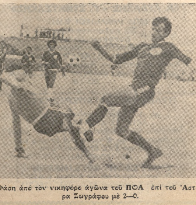
Φάση από τον νικηφόρο αγώνα του ΠΟΑ επί του 'Αστερα Ζωγράφου με 2-0.

'Εθνικού Γυμναστηρίου (Θηλέων) και στην αίθουσα γυμναστικής του Β' Γυμνασίου 'Αρρένων (για τα 'Αρρένων). Στίβος: Θα διεξαχθεί στις 14 Μαρτίου 1979 στο 'Εθνικό Στάδιο. Β' ΠΕΡΙΦΕΡΕΙΑ 'Ανόμιλος δρόμος: Θα διεξαχθεί παράλληλα με το πρόγραμμα της Α' Περιφέρειας. 'Ενόργανη γυμναστική: Θα διεξαχθεί την 30η Μαρτίου 1979. Στίβος: Θα διεξαχθεί στις 29 Μαρτίου στο 'Εθνικό Γυμναστήριο.