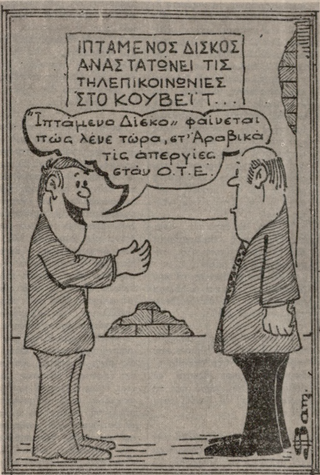
(ΤΟΥ ΒΑΓΓΕΛΗ ΣΑΜΑΡΑΚΗ)