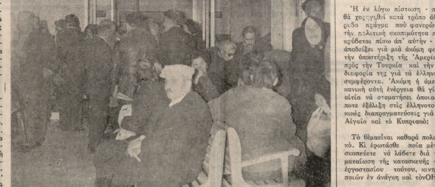
Συνοστισμός παρατηρήθηκε τίς πρώτες ήμέρες για τήν έγγραφη στήν Οίκογενειακό γιατρό. Άφελής μάρτυρας ή παραπάνω φωτογραφία που πάρθηκε χθές τό πρώτο.