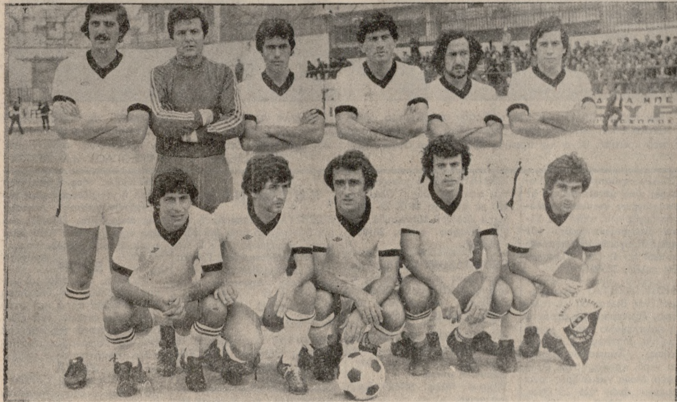
Οί θρυλικοί «μαύροι άετοι» του νότου, οί όποίοι πετούν από έπιτυχία σε έπιτυχία και ήδη ή άπόδοσή τους έχει φτάσει σε ζηλευτά επίπεδα. ‘Ο Ο.Φ.Η., θά γίνει και πάλι ή πρώτη έπαρχιακή ομάδα.