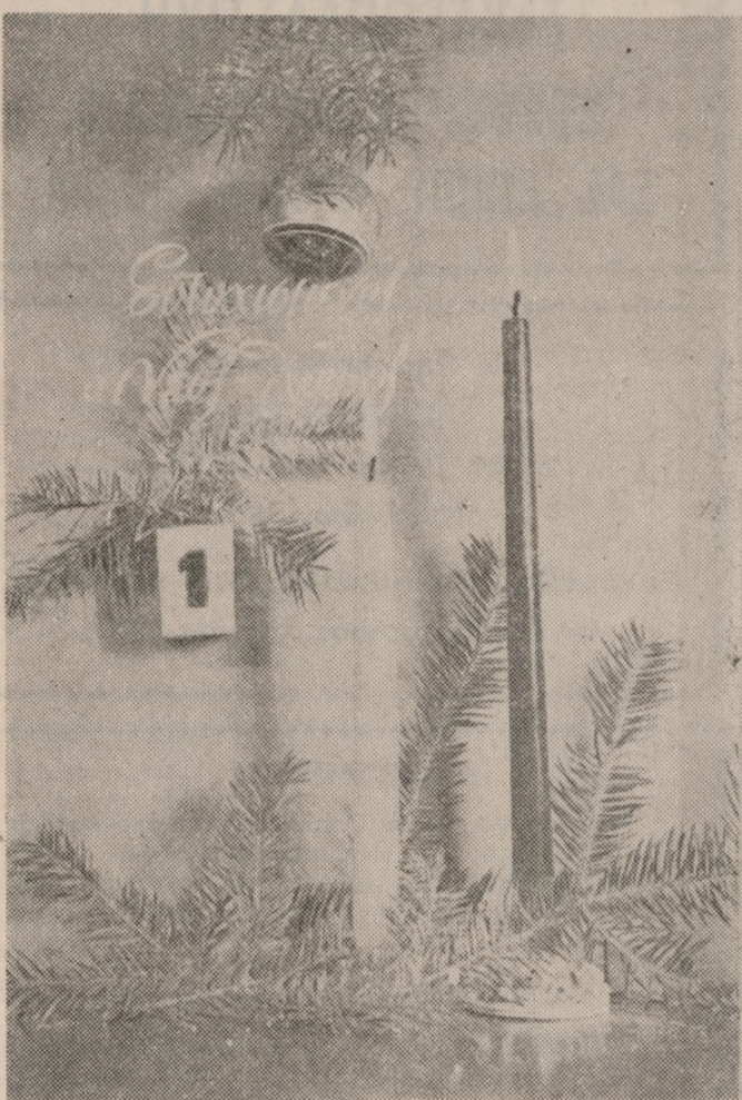
Ένας χρόνος φεύγει, ένας νέος έρχεται. Η «ΠΑΤΡΙΣ» πάνω στο όροσημο της αλλαγής του χρόνου εύχεται στους φίλους, αναγνώστες της και στο λαό του 'Ηρακλείου Εύτυχημένο και χαρούμενο το νέο χρόνο 1979.