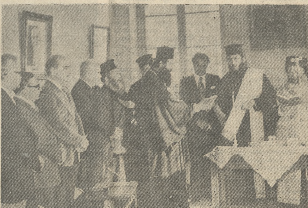
Ένα στιγμιότυπο από τήν τελετή που έγινε τήν Πρωτοχρονιά στήν αίθουσα του Δημοτικού Συμβουλίου Ηρακλείου με τήν εύκαιρία της έγκαταστάσεως της νέας Δημοτικής Αρχής.

Προήλθε ή ομάδα μας, από τίς εκλογές του περασμένου Οκτώβρη. Έκλογές που θά πρέπει να χαρακτηρισθούν σκληρές και πεισματικές για να μείνω στους πιο ήπιους χαρακτηρισμούς. Ξεχνώντας, όμως, ο καθέ-