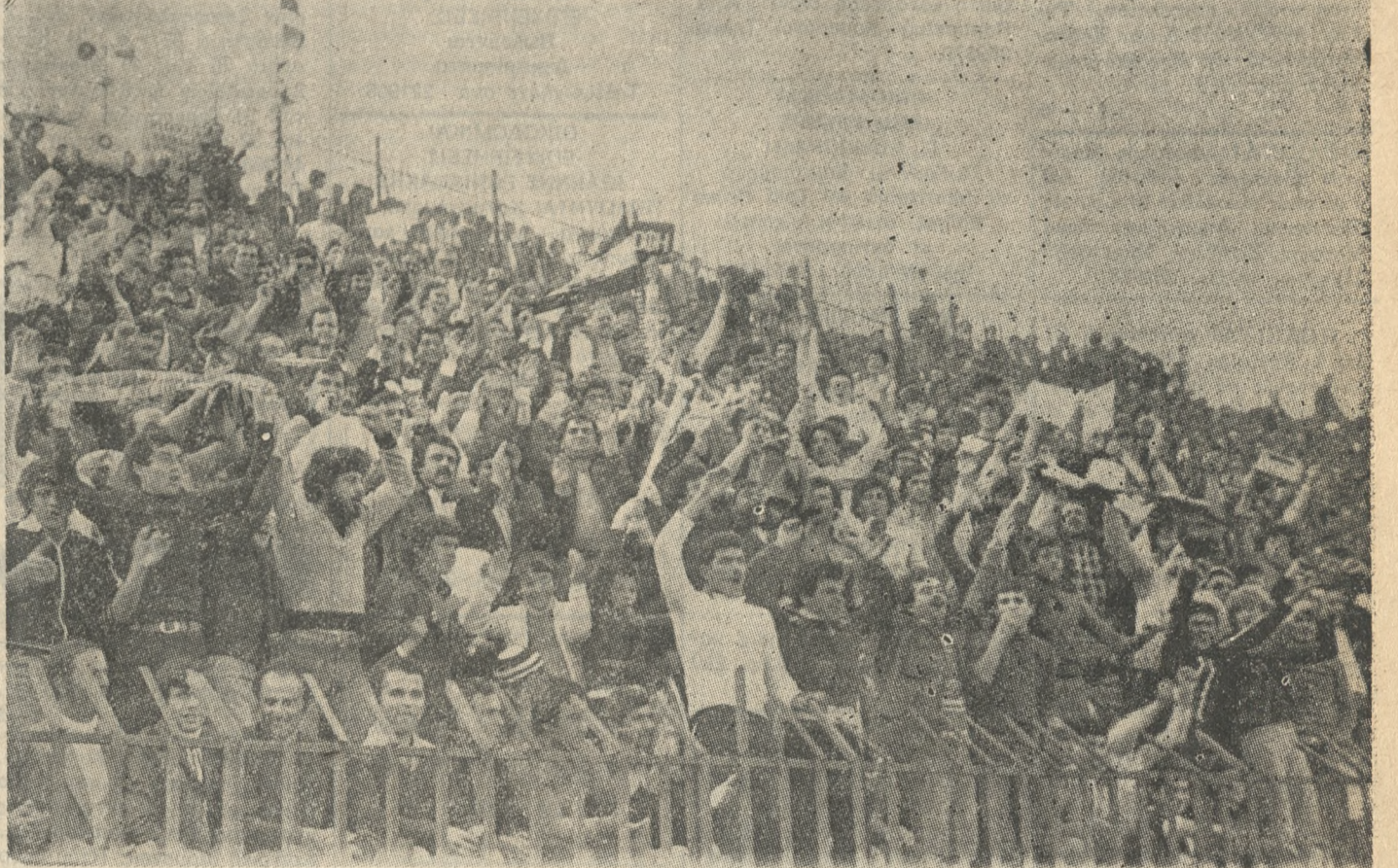
Παρά τó γεγονός ότι τó μάτς ήταν... άχρον, άσομο και άγευστο, οι φιλάθλοι ύψωσαν τήν φωνή τους, χωρίς όμως να καταφέρουν να ζυτηήσουν τις δύο ομάδες.

έλλειψη γηπέδου ήταν τó πλέον καυτό συμπέρασμα τής προχθεσινής συνάντησως ΟΦΗ — ΑΕΚ. Νομίζμε ότι οι Άρχες του τέπου — ο Νομάρχης, οι Βουλευτές, ο Δήμαρχος κλπ. — έχουν ΧΡΕΟΣ να λύσουν τόν πρόβλημα, να λέγεται γήπεδο. Η ταλαιπωρία πολλών από αλλετούς, νά εξασφαλίσουν μιά θέση τήν Κυριακή, νομίζμε ότι θα τους έπεισε για τó πως πρέπει να κάνουν τά αδύνατα δυνατά προκειμένου να κάνουν και στέ Ηράκλειο ένα γήπεδο όπως τής Καβάλας, τής Πάτρας τού Βόλου τής Λάρισας και πολλών άλλων πόλεων, που είναι μικρότερες από τó Ηράκλειο. Και τώρα τó μάτς, μέ τήν διεκρίνιση ότι θα τζ ξαναπούμε για τó θέμα του γηπέδου.