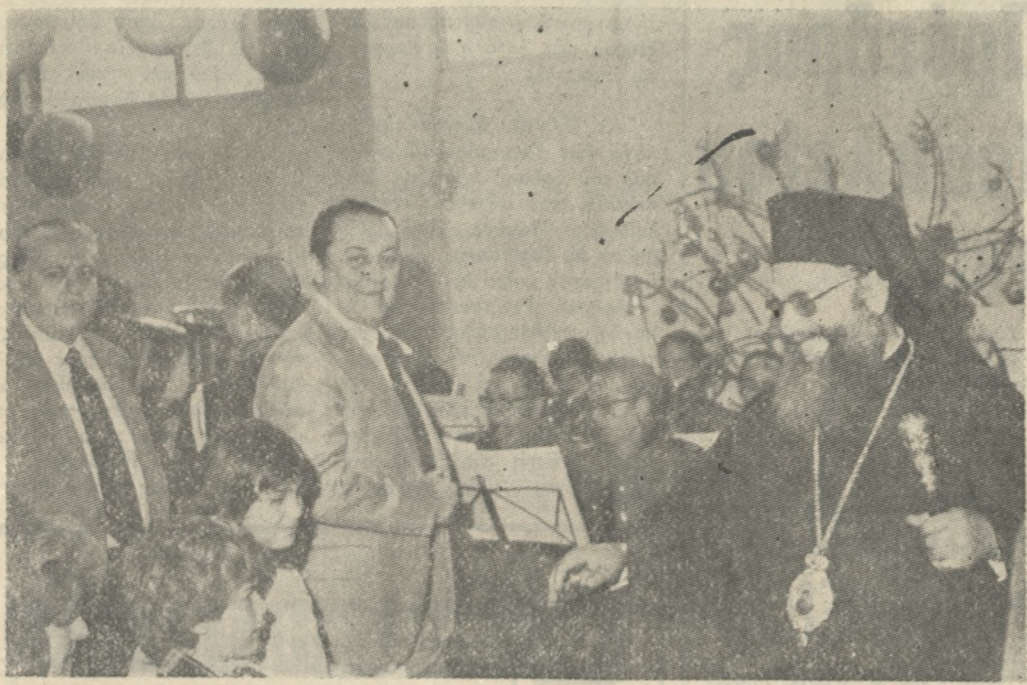
Κατά την διάρκεια γιορτής που έγινε την Κυριακή τό πρώι στο ΕΚΗ δόθηκαν δώρα σε 800 περίπου παιδιά εργατοπαλλήλων του 'Ηρακλείου. Άνωτέρω στη γιόμυτλο από την εκδήλωση αυτή. Φωτορεπορτάζ: Β. ΔΡΟΣΟΣ τηλ. 221830