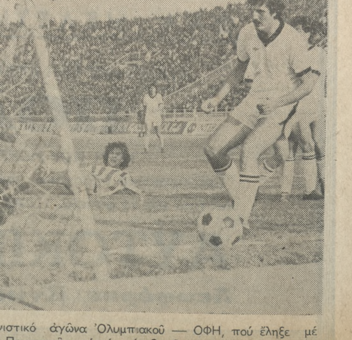
Μιά φάση από τον συγκλονιστικό αγώνα 'Ολυμπιακού - ΟΦΗ, που έληξε με νίκη των Πειραιωτών και με σκορ 2-0.

ΠΟΑ: Πεταράς, Κιουλιόγλου, Φουφάκης, Παπαθεοφάνης.