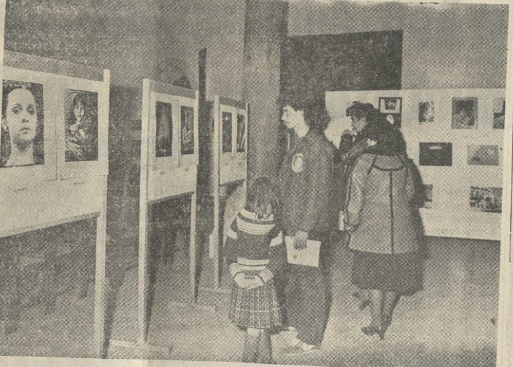
* Τό Παράρτημα 'Ηρακλείου της 'Ελληνικής Φωτογραφικής 'Εταιρείας παρουσιάζει στην αίθουσα της Βασιλικής τού 'Αγίου Μάρκου τήν 15 Μπενιάλε, μονόχρωμη φωτογραφία. Λαμβάνουν μέρος 20 κράτη. 'Η έκθεση θά μείνει άνοικτή μέχρι τήν 15η Φεβρουαρίου. 'Η είσοδος είναι ελεύθερη. 'Ανωτέρω ένα τμήμα αυτής.

Τετάρτη 7 Φεβρουαρίου 79 ΕΡΤ 1.45 Κάθε μεσημέρι 5.45 'Αγγλικά 6.00 Τά νέα μας 6.05 'Ο Κλόουν 6.15 Σάς άρρείει αυτή ή δουλειά; 6.45 'Η Κύπρος κοντά μας 7.00 Ειδήσεις 7.15 'Η άρα του άθλητισμού 8.00 Γράμματα και αριθμοί 8.20 'Η καλή οδηγηση 8.30 'Ιστορικές σελίδες 9.00 Ειδήσεις 9.30 'Ελληνική ταινία 11.00 'Αλ Μαρτίνο 12.00 Ειδήσεις ΥΠΕΝΔ 1.30 Μεσ. πρόγραμμα 5.30 ΟΙ δασοφύλακες 6.00 Τηλεφημερία 6.15 Χθές, σήμερα, αύριο 6.30 'Επί τόν επάλληξον 7.00 'Η μάχη 8.00 Μεθορ. σταθμός 8.45 Συν/ρχης Λιάπκιν 9.30 Τηλεφημερία 10.00 'Η κοταδιώξη 11.00 'Η άστρονομικία 12.00 Τηλεφημερία