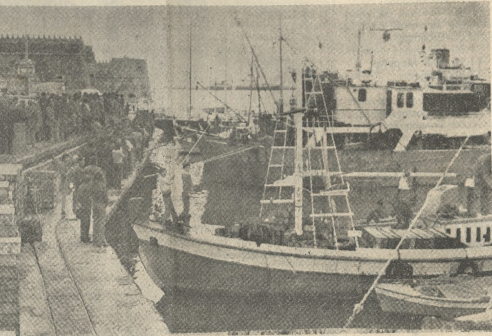
Τό «Αρχάγγελος» καί τό «Ελεάνα» μέλις έχουν επιστρέψει από τήν άναζήτησή τών δύο άγνοουμένων, χέρις τό άπόγευμα. Πλήθος φίλων καί γνωστών περιμένουν στήν παραλία γιά νά πληροφορηθούν αν κάτι βρέθηκε.

ΕΝ τώ μεταξύ τού Ύπουργείου Έμπορικης Ναυτιλίας μέ σημά του γνώρισε χέρις βράδυ τό Κεντρικό Λιμεναρχείο ότι σήμερα από τό πρωί άεροπλά