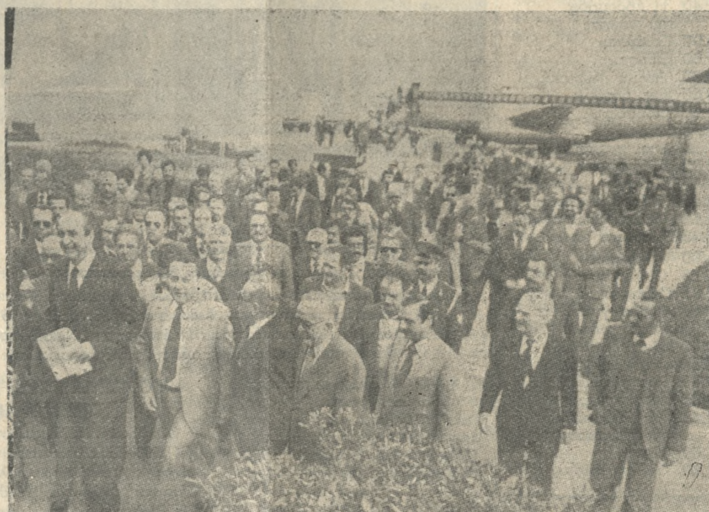
Φωτογραφικό στιγμιότυπο ἀπὸ τὴν ἄφιξη τὸ ὑπουργὸ Ἰ. Μητσotάκη στὸ ἀεροδρόμιο.

Ο ΛΑΟΣ του 'Ηρακλείου είναι άποφασισμένος να αγωνιστεί με όλα τα νόμια μέσα για να μην ψηφιστεί τὸ σύνολο του από την Βουλὴ τὸ Νομοσχέδιο για τὸς συντελεστὲς δομῆσεως στην πόλη μας. ΑΥΤΟ ήταν τὸ συμπέρασμα που διήρξε ἀπ' ἄπὸν χθεσινὴ μεγάλη σύσκεψη που πραγματοποιήθηκε χθὲς τὸ μεσημέρι στην αίθουσα τὸ Δημοτικὸ Συμβούλιον 'Ηρακλείου. ΜΕΤΑ ἀπὸ διεξοδικὴ συζήτηση πολλῶν ὁρῶν ἀποφασίστηκαν τὰ ἑξῆς: