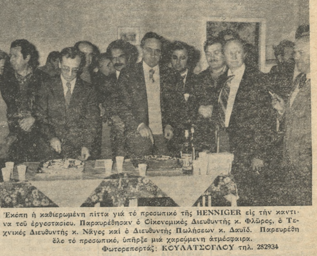
'Εκπία ή καθιερωμένη πίττα για το προσωπικό της HENNIGER εις τήν καντίνα του έργοστασιου...