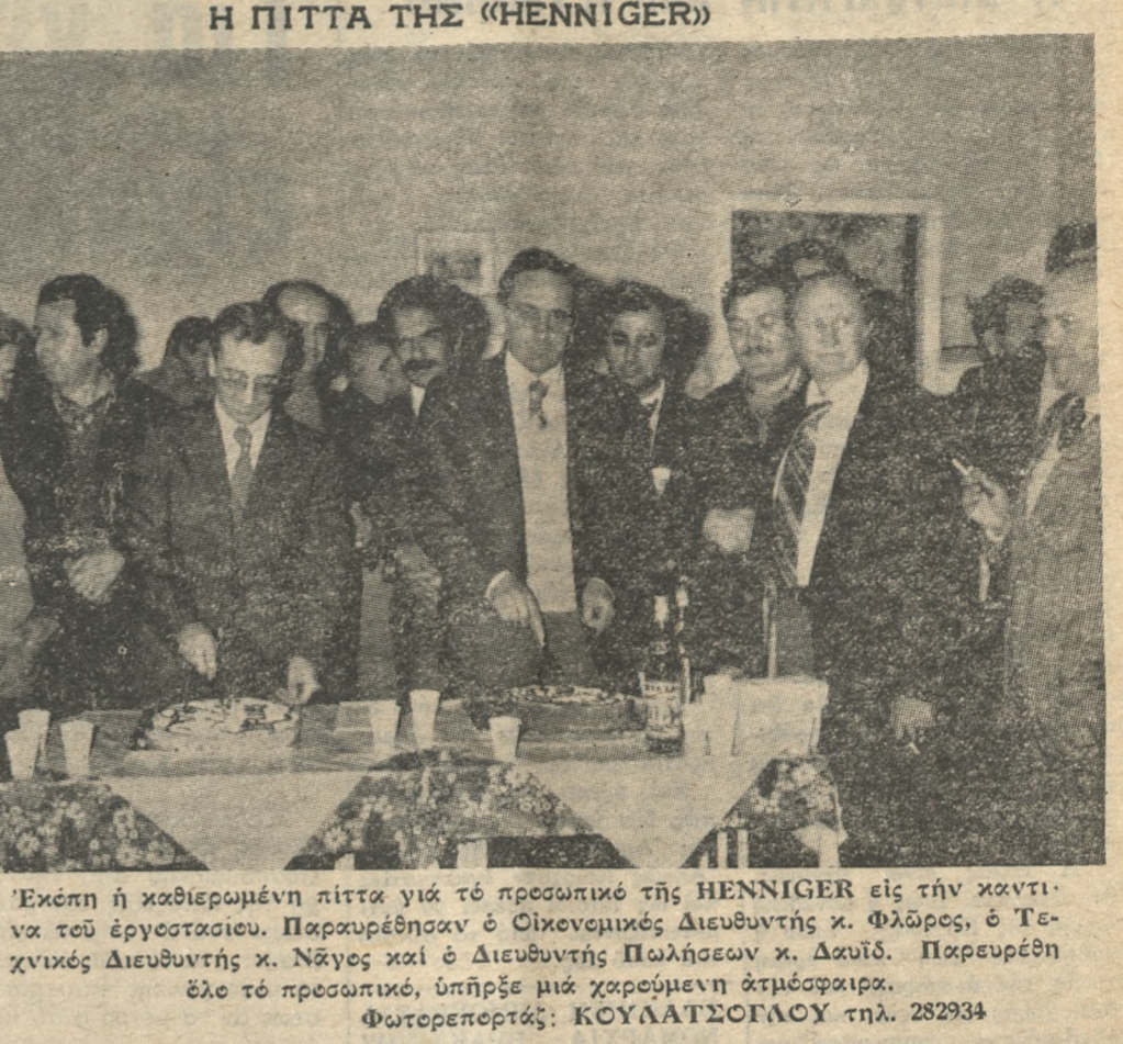
'Εκπία ή καθιερωμένη πίττα για το προσωπικό της HENNIGER εις τήν καντίνα του έργοστασιου...