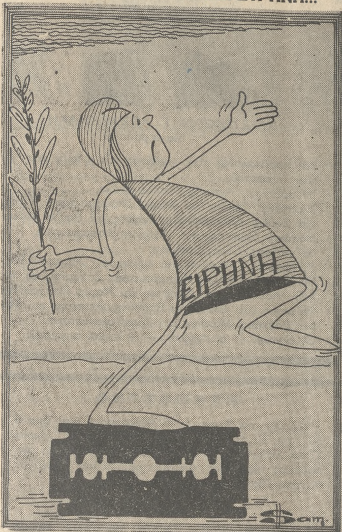
(Τού ΒΑΓΓΕΛΗ ΣΑΜΑΡΑΚΗ)