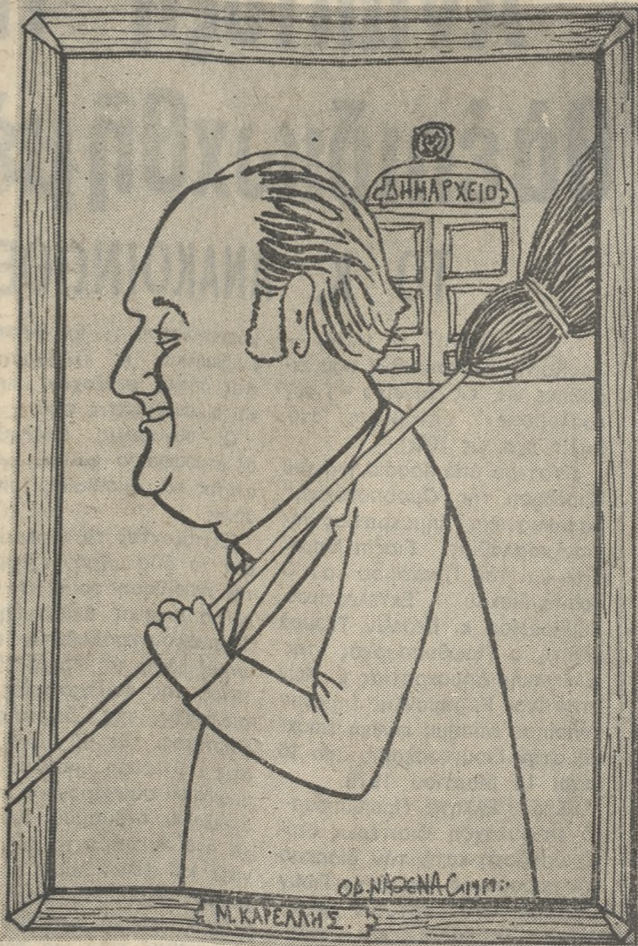
ΕΤΣΙ ΕΙΔΕ ΤΟΝ ΔΗΜΑΡΧΟ Ο ΟΔ. ΝΑΘΕΝΑΣ