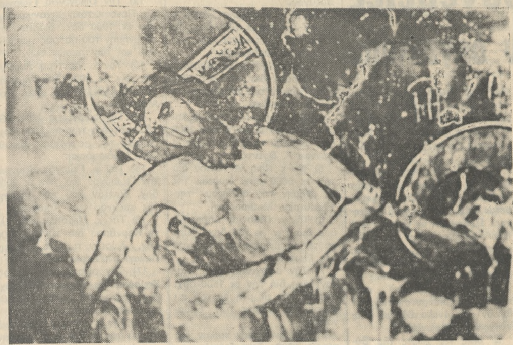
«Ο ευσχήμενος Ίωσήφ από του Ξύλου καθελών τό άκραντό σου Σώμα...»