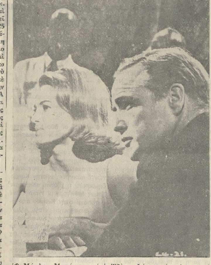
Ο Μάρλον Μπράντον και η Τζέην Φόντα σε μία σκηνή άπό τίν ταινία «ΚΑΤΑΔΙΩΞΗ» που προβάλλεται σήμερα και αύριο στόν κινηματογράφο «ΓΑΛΑΞΙΑΣ». Είναι μία από τίς καλύτερες ταινίες της COLUMBIA.

ΠΑΓΚΡΗΤΙΑ σύσκεψη άρμόδιων παραγόντων θά γίνει στό Ήρακλείο για νά συζητηθούν δύο θέματα που «κάνει» κυρίως τίς παραγωγικές τάξεις. Τά θέματα αυτά είναι: 1. Ο Νόμος περί δραματικού κέρδους και 2. Οι δικηγορικές παραστάσεις σ'ά συμβόλαια. Εϊδικοί εισηγητές θά αναπτύξουν τά θέματα και θά έπακολουθήσει συζήτηση.