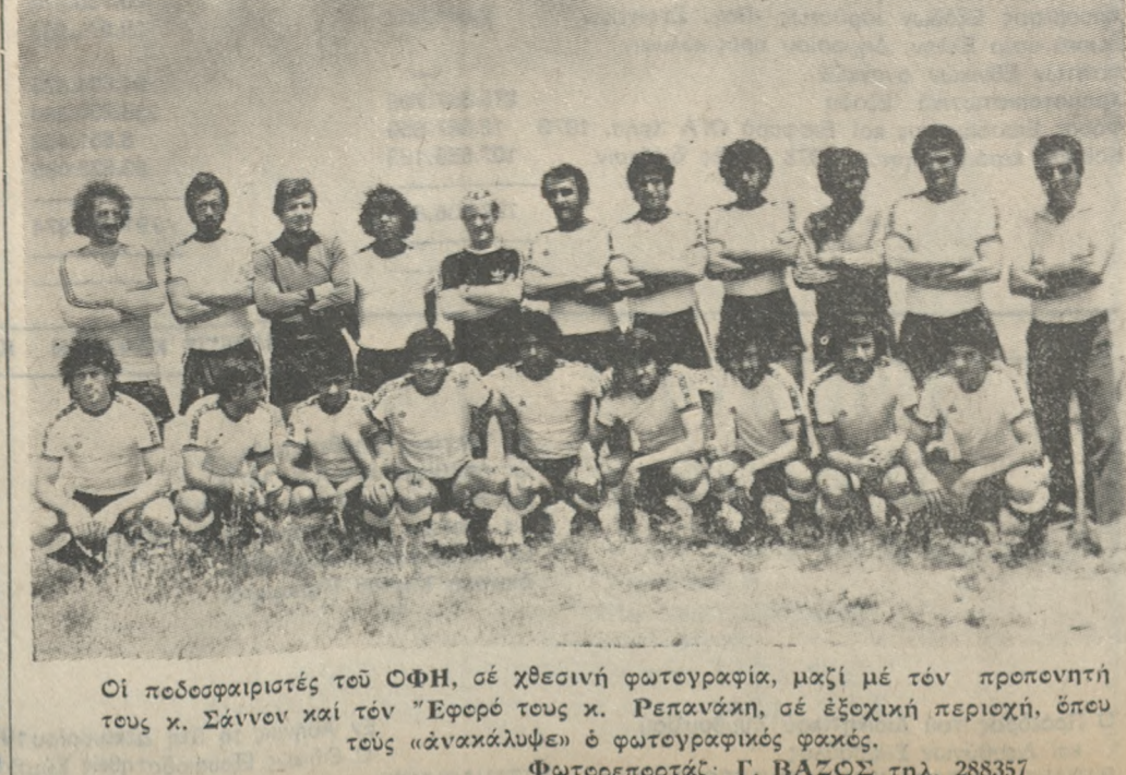
Οι ποδοσφαιριστές τού ΟΦΗ, σε χθεσινή φωτογραφία, μαζί με τόν προπονητή τούς κ. Σάννον και τόν κ. Ρεφανάκη, σε έξοχική περιοχή, έπου τούς άνακάλυψε ο φωτογραφικός φακός.