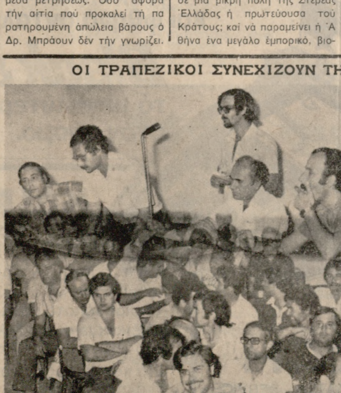
Ότε χτές έλειτούργησαν οι Τράπεζες. Οι άπεργοί άπτόητοι συνεχίζον τόν κώναν τους και στο Ηράκλειο, όπως άπεράσισε τή Δευτέρα τή έραύο ή Γενική τους Συνέλευση. Στη φωτογραφία μας ένα στιγμιότυπο άπο τή συνέλευση αυτή.

θμοί δέν συνοδεύτηκαν άπο άνά λογα έργα ύποδοχής, και ούτε ήταν εύκολο να συνοδευτούν. Έτσι ή σημερινή Άθήνα με τήν κακή τής πολεοδομική κρότηση, με τό πολύ στυγρό τής όδοό δικτυο, με τες άνεπαρκείς συγκοινωνίες τής, με τή μόνιμη κυκλοφοριακή τής συμφόρηση, με τό έλλεινο άπο τεύσταση που έπικρατεί σήμερα μέσα στην πρωτεύουσα τής χώρας μας που όδηγείται, όλοταχώς, σε πλήρη συμφόρηση και καταστροφή. Η Άθήνα άποτελεί σήμερα τό κλασικότερο παράδειγμα ύδροκεφαλισμού μέσα σ' όλόκληρο τόν κόσμο. Τείνει να συγκεν τρωσει άπύ τήν περιοχή τής τό μισό σχεδόν πληθυσμό τής Έλλάδας και τό μεγαλύτερο μέρος του εργατικού και πνευματικού δυναμικού τής χώρας. Σήμερα ο πληθυσμός τής αυζά νεται κατά 100—120 χιλιάδες άτομα τό χρόνο. Ίδου μερικά χαρακτηριστικά τής στοιχείο: 1) Πληθυσμός τής Άθήνας: Τό 1961 κάτοικοι 1.850.000, τό 1979 κάτοικοι 3.680.000 — ή τόν αύξηση 98.7ο). 2) Κατομίες: Τό 1961 κατοικίες 502.460 και τό 1976 κατοικίες 1.037.000 — ή τόν αύξηση άνω τών 100ο). 3) Ίδιωτικά αυτοκίνητα: Τό 1961 ιδ. αυτοκ. 400.000 και τό 1978 ιδ. αυτοκ. 400.000 — ή τόν αύξηση 1.230ο). Σήμερα κυκλοφορούν στην Άθήνα 5.000 λεωφορεία, 30.000 τοξί και 400.000 ιδιωτ. αυτοκί νητα. Ίτοι σύνολον 435.000 άυ τοκίνητα χωρίς τό τρικύκλο και τό μηχανήματα και τό ξένα αυτοκίνητα. Ύπολογίζεται ότι τό 2000 θά κυκλοφορούν γύρω και μέσα στην Άθήνα 2 έκατομμύρια περίπου τροχοφόρα. Οι έκπληκτικοί αυτοί άρι