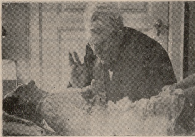
Η άνωτέρω σκηνή είναι από τήν ταινία πού κατέρριψε και συνεχίζει να καταρρίπτει όλα τὰ ρεκόρ εισιτηρίων σε όλο τον κόσμο.

«Ο ΕΞΟΡΚΙΣΤΗΣ No 1 Που θα προβληθεί άύριο και τήν Τρίτη στον κιν/φο «ΑΜΟΡΕ». Πρωταγωνιστούν ή δραβευμένη ΛΙΝΤΑ ΜΠΛΑΙΡ - ΜΑΞ ΦΟΝ ΣΥΝΤΟΒ - ΕΛΛΕΝ ΜΠΕΡΝΣΤΥΝ. Η ταινία πού προκαλεί ΣΟΚ! Έθρησκευτικό δόος! Φόβος για τας άόρατες ύπερφυσικές δυνάμεις! Φρίκη για τόν ώμο ρεαλισμό της! Δέν υπάρχουν λόγια να περιγραφή!