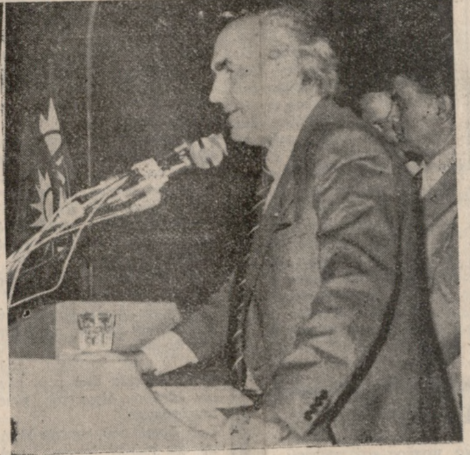
Ο κ. Παπανδρέου σε συνομιλία με τους πολιτικούς συντάκτες εξαρχαίτησε ως πρόωρα τα δημοσιεύματα για προσχώρηση στο ΠΑΣΟΚ και πρόσθεσε ότι το κόμμα ασχολείται με το θέμα της έγκρισης επίλογής των υποψηφίων στις προσεχείς εκλογές.

Αναφερόμενος στις επικείμενες επισκέψεις του κ. Προθυπουργού σε διάφορες περιοχές εξέφρασε την γνώμη ότι θα περσι προσηχη ο κ. Καραμανλής να ενημερωθεί την αντίπολη.