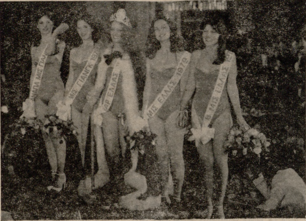
Από την ατέφη της «ΣΤΑΡ ΕΛΛΑΣ 1979» στο Ξενοδοχείο «Μίλτον». Όπως είναι γνωστό η φετινή νικήτρια του Διαγωνισμού για την «ΜΙΣ ΚΡΗΤΗ» 3x συμπεριληφθεί άνευ συναγωνισμού στην τελική δαδεκάδα των Καλλιστείων για την «ΣΤΑΡ ΕΛΛΑΣ 1979»