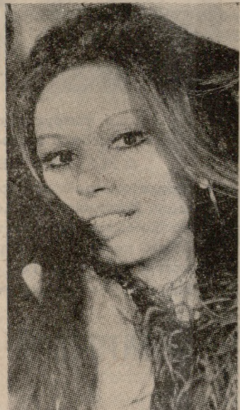
ΡΙΚΑ ΔΙΑΙΛΙΝΑ «ΣΤΑΡ ΕΛΛΑΣ»

Το απόγευμα έχουμε το πρώτο καρδιοχτύπι για όλες τις πόλεις που θα παρουσιάσουν στην επιτροπή ή οποία θα εξημερίσει τις οκτώ κοπέλες που θα εφραρισθούν την Κυριακή το βράδυ στο κοινό του Ηρακλείου διεκδικώντας τον τίτλο της όμορφωτέρας Κρητικής πούλας.