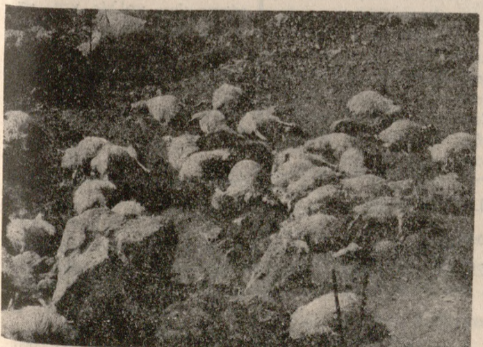
Εικόνα φρίκης: Τα σφαγμένα πρόβατα

Και πράγματι τα ξημερώματα η εικόνα ήταν φρικιαστική κι απεριγράπτη, μια ταινία θρίλερ. Πενήντα ενιά (59) πρόβατα σφαγμένα, κι όλα έτοιμα να γεννήσουν, μάλιστα ένα δυό απ' αυτά σφάχτηκαν την ώρα που γεννούσαν. Ούτε δηλ. κι αυτή ακό... ★ ΣΥΝΕΧΕΙΑ ΣΤΗ ΣΕΛΙΔΑ 2