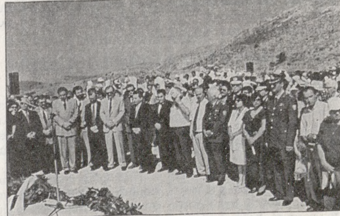
Οι επίσημοι που πήραν μέρος στην τελετή του Μνημοσύνου. Στη θέση αυτή από τυπογραφική αβλεψία βρέθηκε η φωτογραφία των εκπροσώπων της εκκλησίας