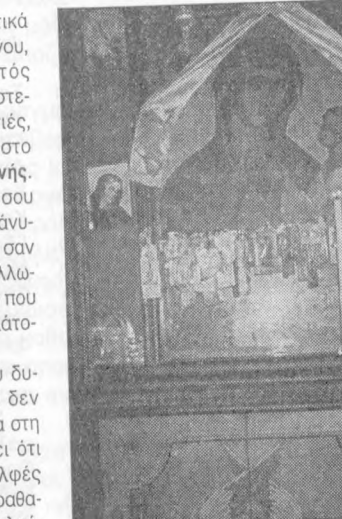
Σωτήρος Χριστού, με την ένδειξη «Χείρ Αγγέλου». Πολλά θαύματα έχουν γίνει στο μοναστήρι αυτό, όπως διηγούνται παλιοί Βιαννίτες, τα οποία όμως δεν εκκοινοποιούνται λόγω αρνήσεως των μοναχών, για να μη θεωρηθεί αυτό ως προβολή του μοναστηριού!

Αλλά η κυριότερη αξία του μοναστηριού είναι οι παμπάλαιες (πλέον των χιλίων ετών) δεσποτικές εικόνες του τέμπλου με τη θαυματουργή εικόνα της Παναγίας (βρεφοκρατούσας) και του