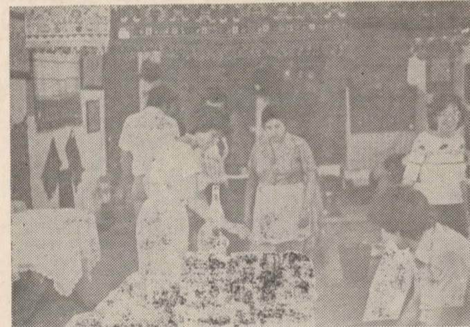
Ἀπὸ τὴν προετοιμασία τῆς ἐκθεσης.

φο του Χατζηαναγνώστη ματαϊώθηκε γιατί ὁ δρόμος εἶναι ἀδιάβατος. Ἐτσι φάνηκε για μὴ ἀκόμη φορὰ ἡ ἀνάγκη νὰ φτιαχτῆ ὁ δρόμος πρὸς τὸ Ἰερό του Ἐρμῆ και τῆς Ἀφροδίτης, για νὰ μποροῦν νὰ τὰ ἐπισκεπτόνται πολλοὶ δικοὶ μας και ξένοι που τὸ ἐπιθυμοῦν. Ἀλλὰ με λίγη προσπάθεια μπορεῖ νὰ προχωρήσει πρὸς τὸν «Ομαλό» και νὰ δοθῆ ἡ δυνατό