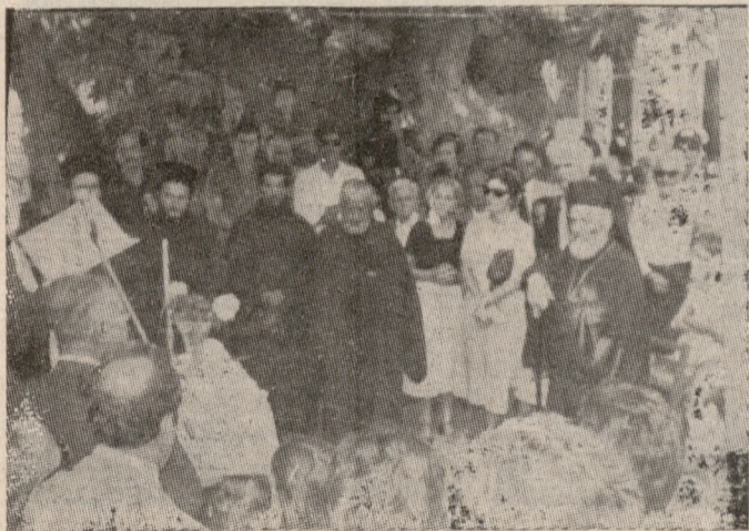
Από τον αγιασμό.

1870 πατανίες, φιλέδες, κουρτίνες, ασπροκνήματα, κάδρα χρυσοκέντητα και από κουκούλια, πλεκτά από ίνες αθανάτου