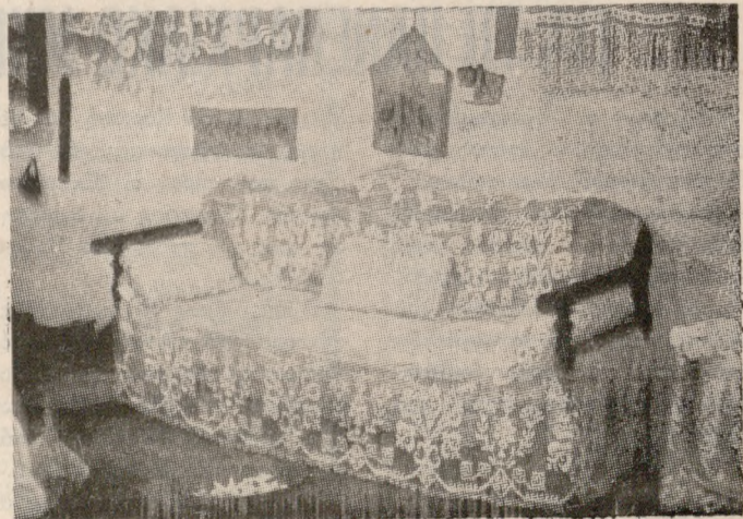
Ένα ἄλλο τμήμα ἀπὸ τὴν ἐκθεση.

Δέντρο αἰωνόβιο ἡ Βιάννος που ἀντιστᾶται στὶς καταγίδες τῶν καιρῶν, στὶς ἐπιδρομῆς τῶν βαρβάρων φασιστῶν, στὰ κύματα του ἀμφισβητούμενου δυτικῶ «πολιτισμοῦ» που φυλάει σὺς κλάδους της πολυτιμὸ ἀνθρώπινο ἀποκτημα: τὴ μεγάλη πολιτιστικὴ κληρονομιά της».