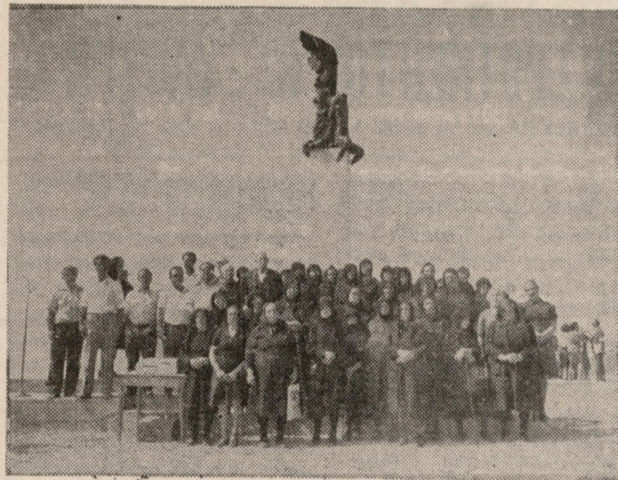
Αυτοί που σώθηκαν από τίς έκτελέσεις και χήρες τών θυμάτων μπροστά στό Ήρώ