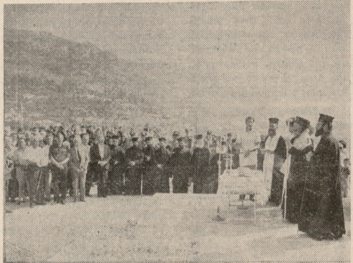
Άπό την τέλεση του μνημοσύνου